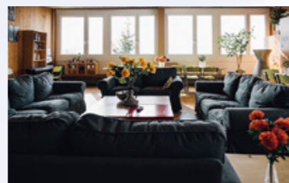
女子寮(7~9学年)。年齢ごとに寮が分かれる