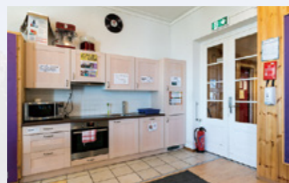
寮にはキッチンも完備