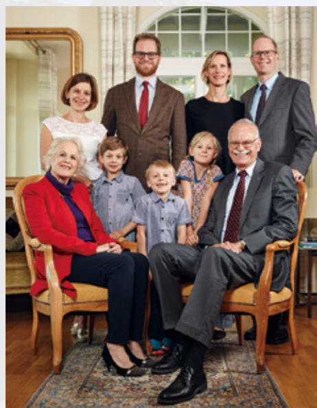
「レザンアメリカンスクール」オットー理事長の家族写真